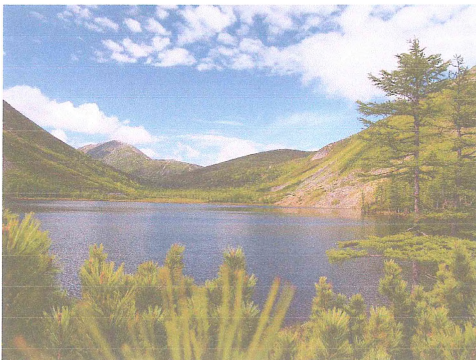
2. Озеро Корбохон.