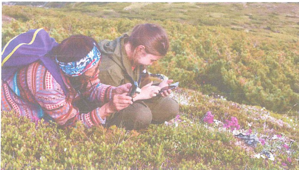
3. Перевал на маршруте.