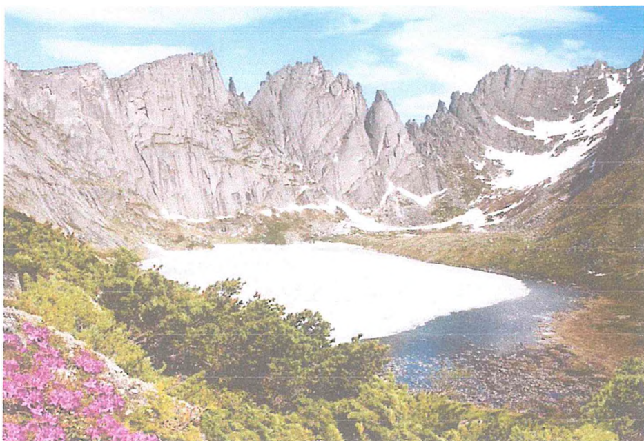
1. Жемчужина Дуссе -Алиня озеро Медвежье. Автор И. Ольховский