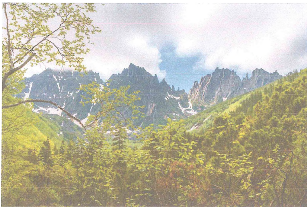
4. Хребет Дуссе-Алинь. Автор Л. Игнатова