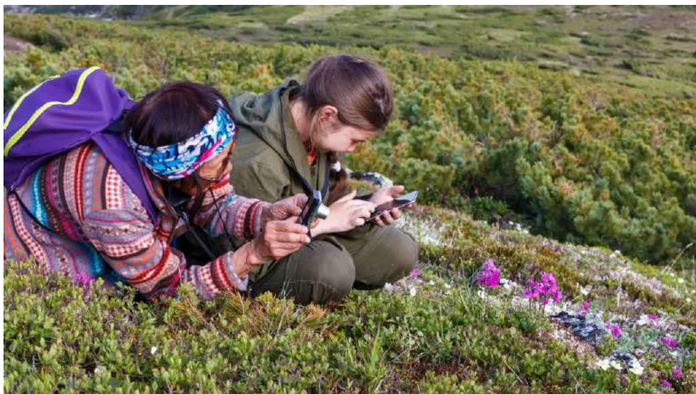
3. Перевал на маршруте. Автор А. Трахан