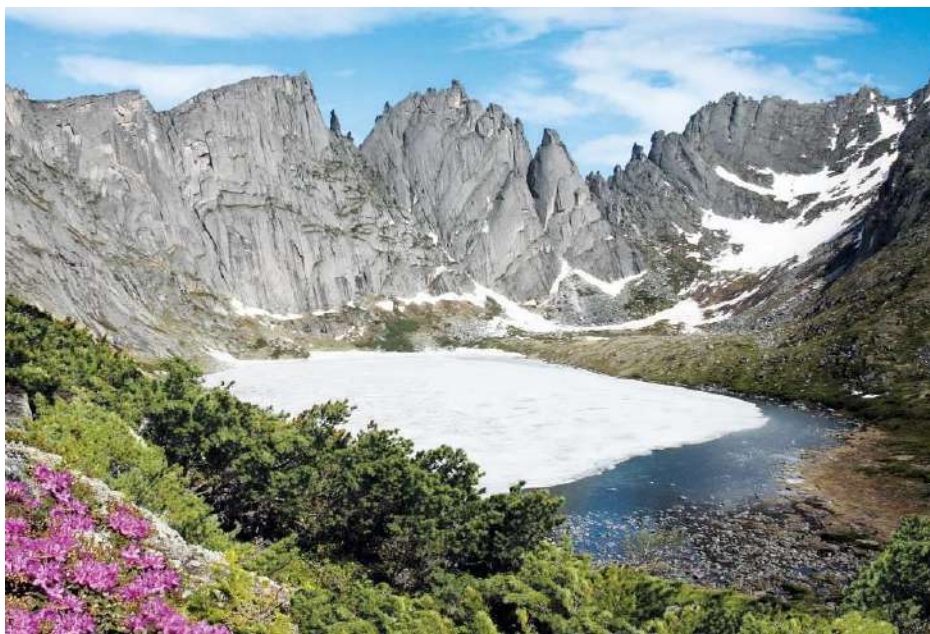
1. Жемчужина Дуссе -Алиня озеро Медвежье.