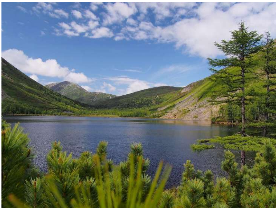
2. Озеро Корбохон.