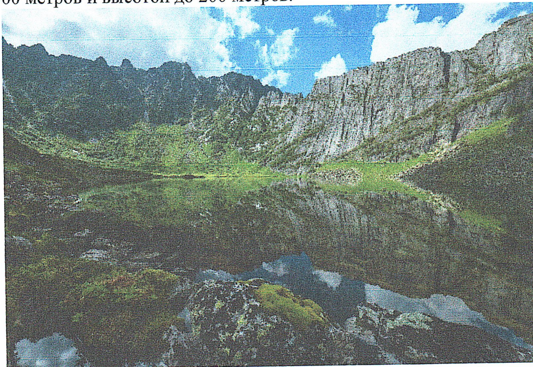
Фото "Озеро Горное"

Озеро Горное. Одно из озер, непосредственно примыкающих к массиву пика Непрístupный с юго-восточной стороны. Озеро расположено на высоте 1525 метров над уровнем моря и имеет в длину 453 метра, а в ширину 219 метров. С севера озеро окаймляет гранитная стена протяженностью около 900 метров и высотой до 200 метров.