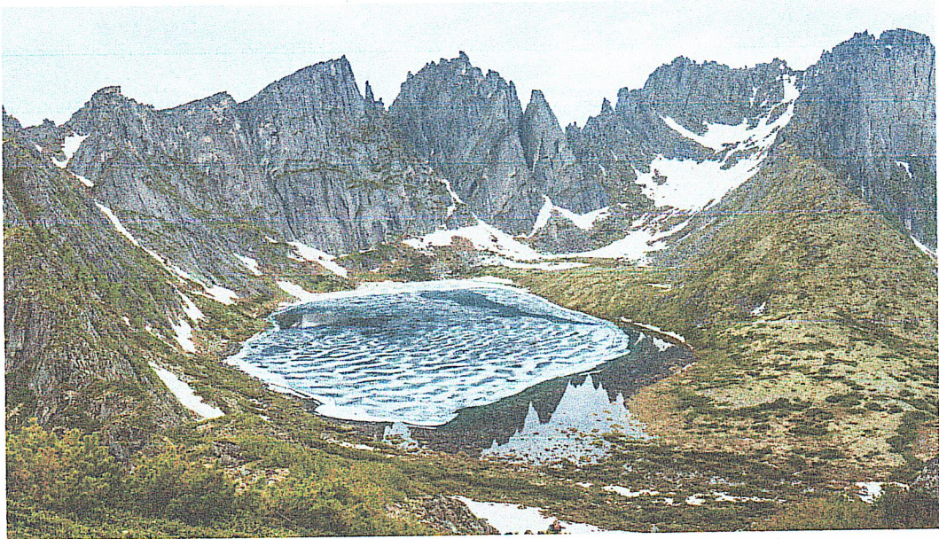
Фото "озеро Медвежье"

Пик Непроступный 2078 м. Седьмая по высоте вершина хребта Дуссе-Алинь. Массив горы сложен из гранитных пород, зачастую образующих стены и узкие гребни с отвесами со всех сторон. На вершину ведут альпинистские маршруты 2А-3А к.с. Вершина является границей заповедника.