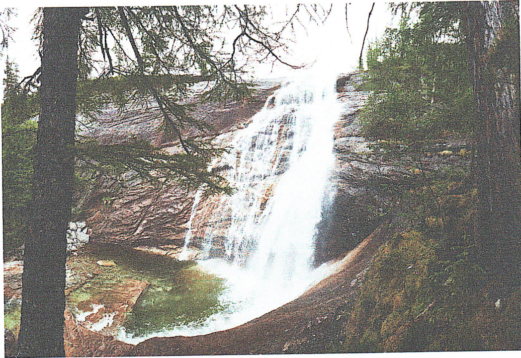
Фото «Водопад Медвежий» автор GeneOгyx

Водопад «Медвежий» самый большой водопад в районе. Находится непосредственно на территории Буреинского заповедника. Расположен на небольшой речке, берущей свое начало под мореной озера Медвежьего. По сути, это вода из озера бегущая к реке Курайгагна. Удивительно, но водопад был открыт лишь в начале этого века. Поэтому его иногда называют «Неожиданный». Высота основного сброса составляет около 50 метров, в то время, как общий перепад высоты достигает 70 метров. Зажатый в горах и со всех сторон закрытый лесом, лед на водопаде частично сохраняется до июня.