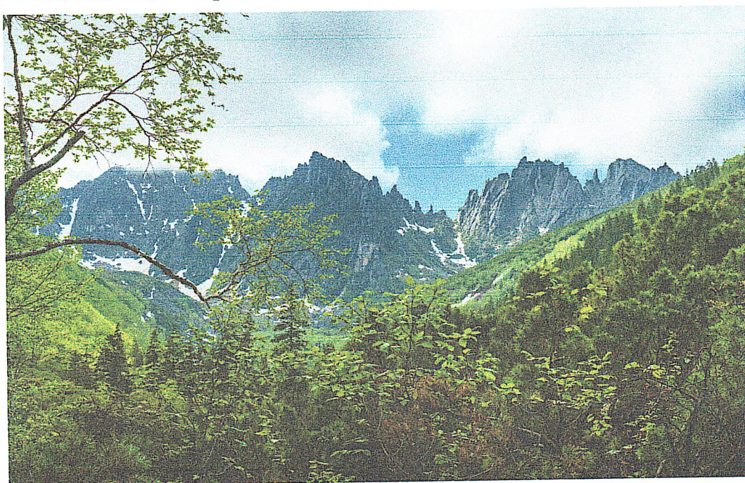
Хребет Дуссе-Алинь