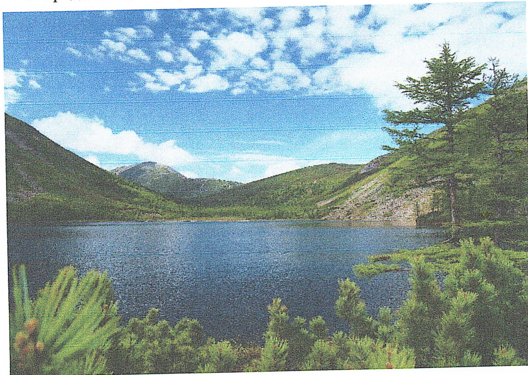
Фото “озеро Корбохон” автор Д.Погодаев

Условия размещения: Палаточный лагерь (спальники, коврики одеяла не предоставляются).