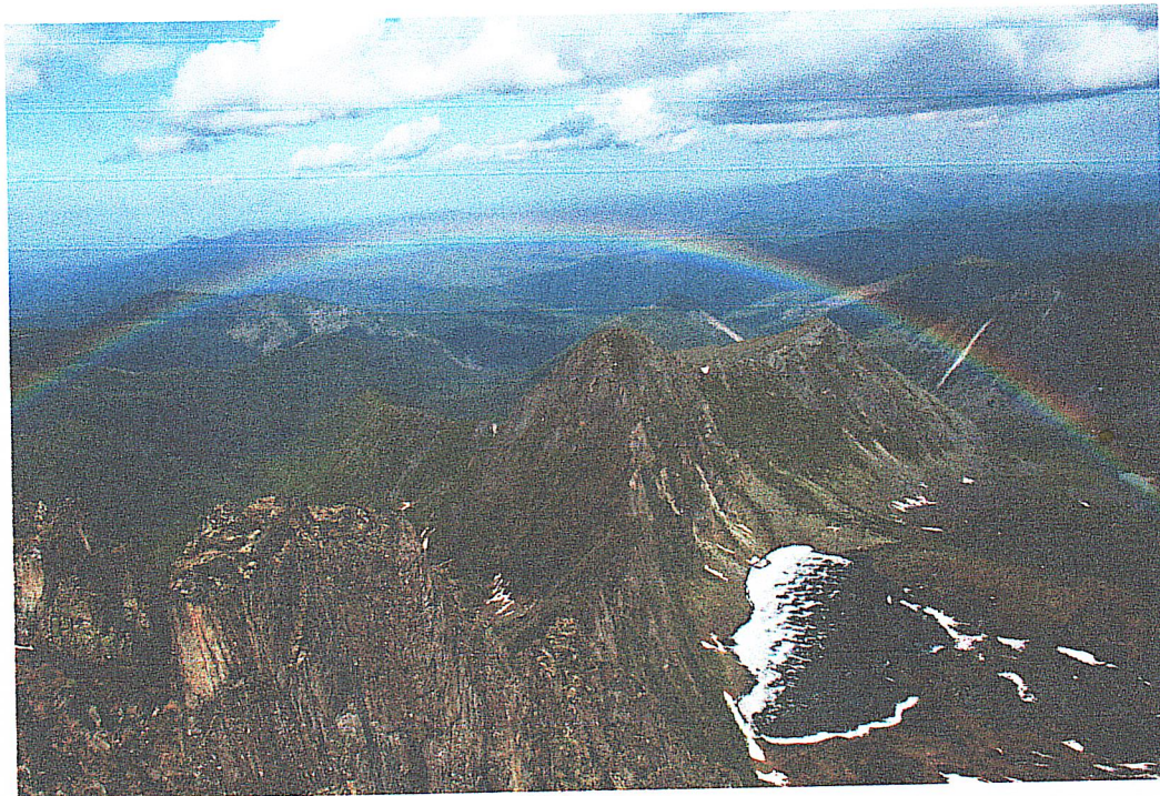
Фото “Хребет Дуссе-Алинь” автор Б.Мавланов

В первый день мы пройдем примерно 4 км. от п. Попутное до устья реки Гремячий лог (на пути перейдем четыре больших ручья в брод). За время пути делаем остановки для принятия пищи, отдыха и фотосъемок. С первого дня вашему взору откроется всё великолепие Дуссе-Алиньского хребта, красота горных рек и сказочного леса с разнообразными мхами и лишайниками.